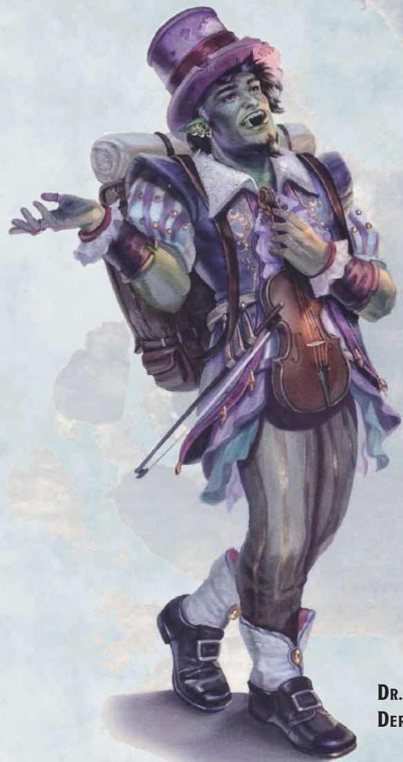
DR. DRANZEL DER GRINSER

Diese Fähigkeit muss mit Vorsicht eingesetzt werden, weil nicht alle die diese Ballade kennen sind deine Freunde. Einige sind Verräter, Doppelagenten, oder Agenten der Tyrannei.