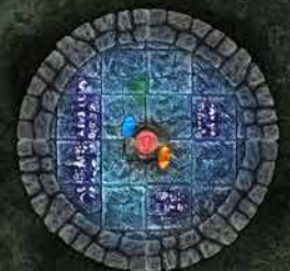
EL OBSERVATORIO DE LOS MUNDOS MUERTOS