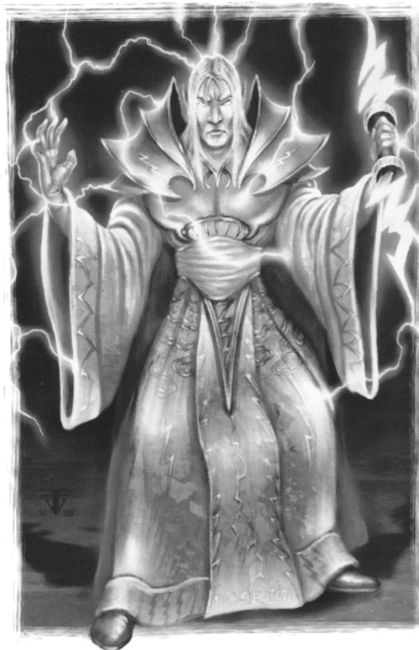
CAMMINI LEGGENDARI DEL WARLOCK

Colpito: 1d10 + modificatore di Carisma + modificatore di Intelligenza danni da fulmine.