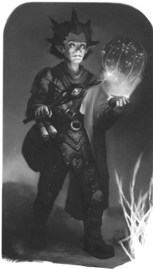
CAMMINI LEGGENDARI DEL WARLOCK

Colpito: 1d8 + modificatore di Costituzione danni da fuoco e radiosi. Fino alla fine del turno successivo del personaggio, il bersaglio considera tutte le creature come se fossero dotate di occultamento.