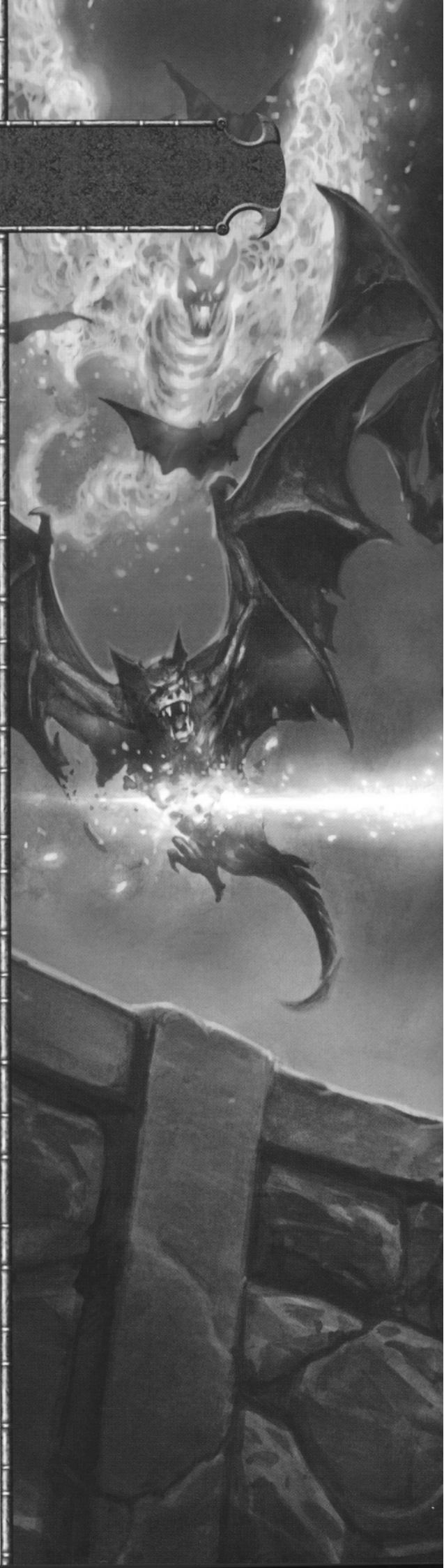
ZOLTAN BOROS & GÁBOR SZIKSZAI