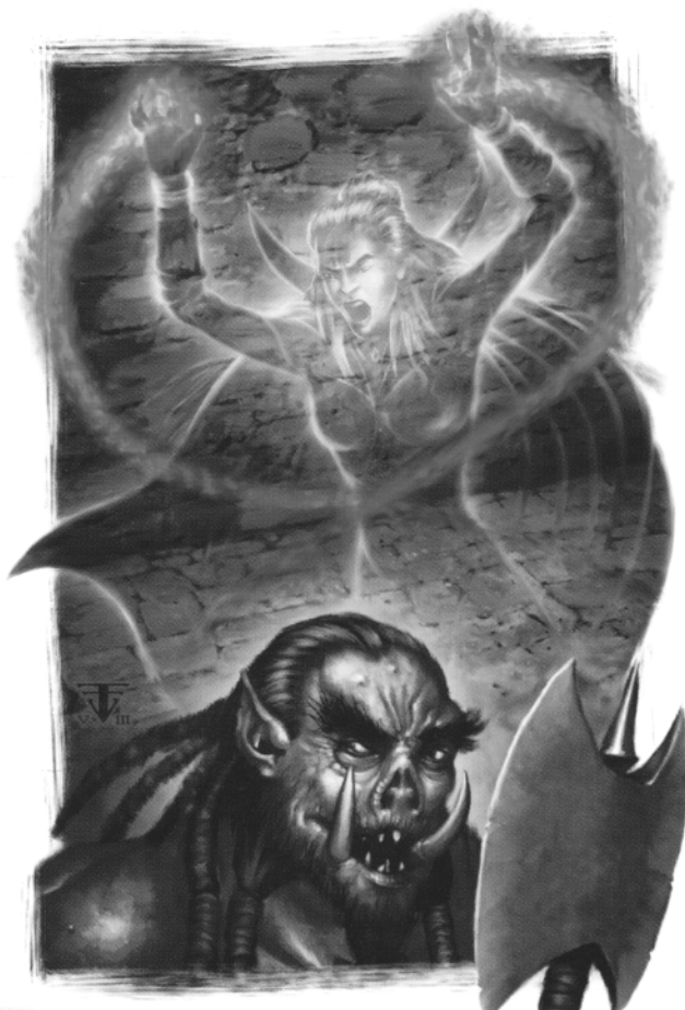
CAPITOLO 2 | Mago

Invisibilità Potenziata (11° livello): Ogni volta che il mago occulto usa un potere arcano che lo fa diventare invisibile, tira un d20 alla fine della durata dell'invisibilità. Se ottiene un risultato di 10 o più, resta invisibile